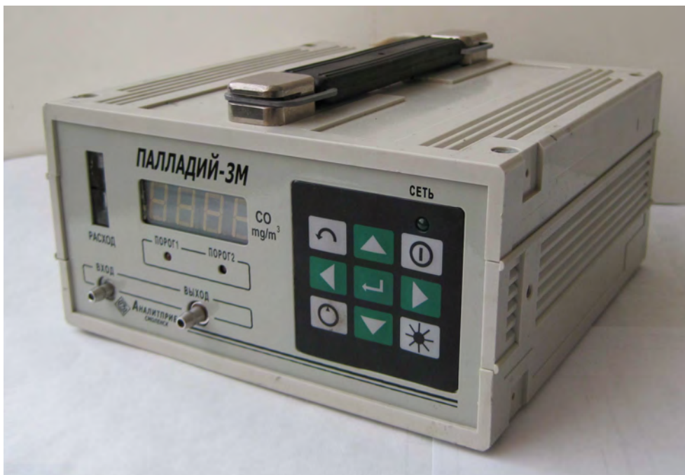
Рисунок 1 - Внешний вид газоанализаторов

Внешний вид газоанализаторов показан на рисунке 1.